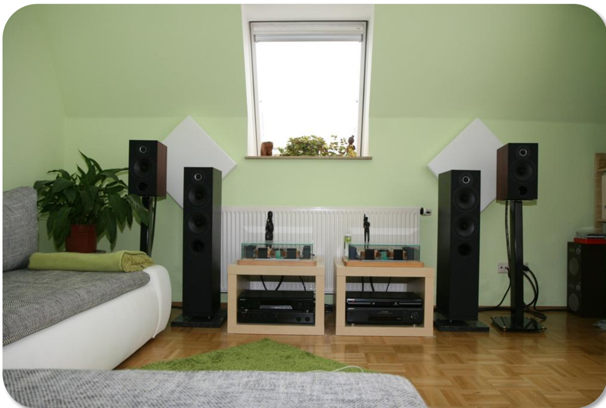
Tesi 560 mit ihrer kleinen Schwester Tesi 260